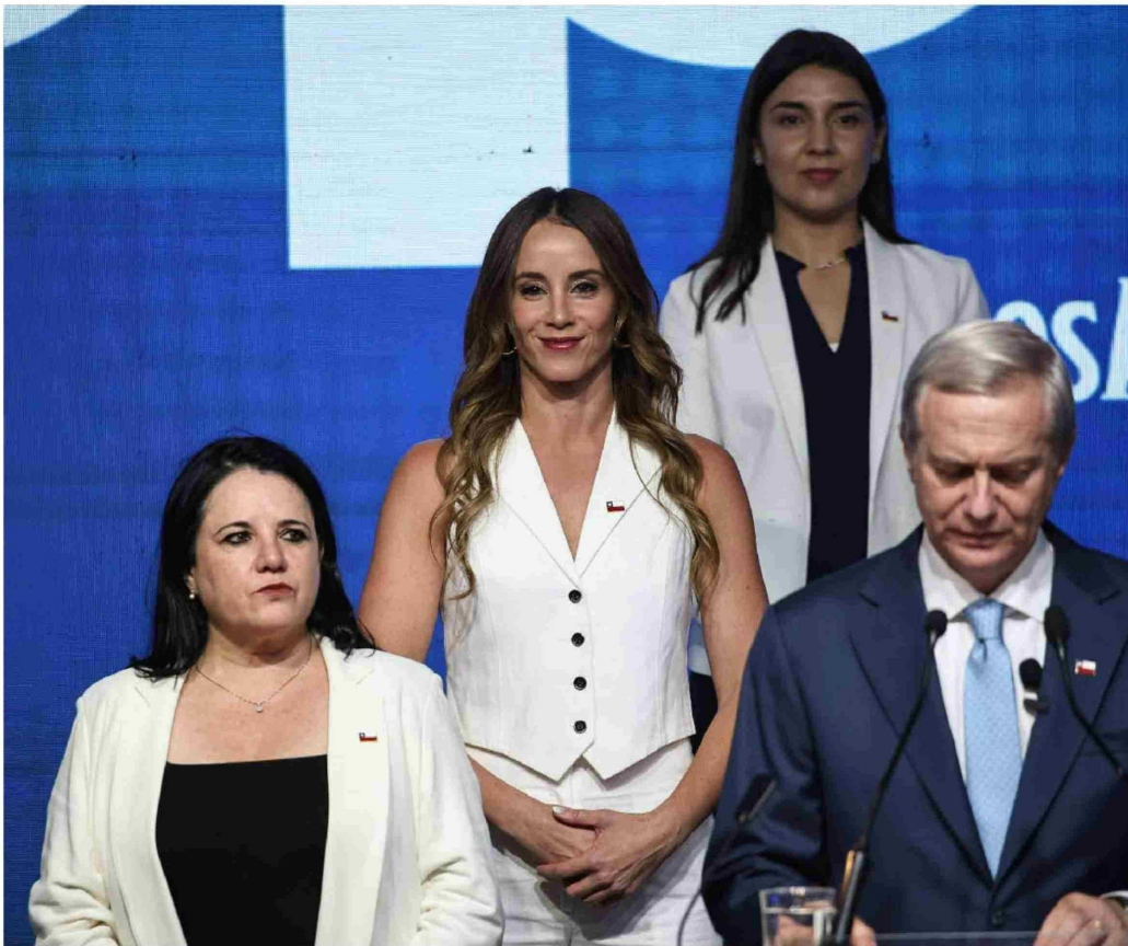
► La futura ministra vocera de Gobierno, Mara Sedini, detrás del presidente electo y la ministra de Seguridad.

Tiraje: 78.224 Lectoría: 253.149 Favorabilidad: No Definida