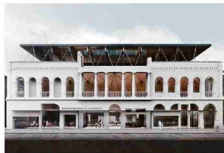
RENDER DEL FRONTIS CORRESPONDIENTE AL PROYECTO GANADOR.

por parte de la consultora el próximo 30 de junio al Servicio de Patrimonio y el ministerio de Obras Públicas (MOP) para su revisión. Paralelo a ello, el Servicio estaría a la espera de recursos para cerrar el perímetro del edificio hasta su ejecución.