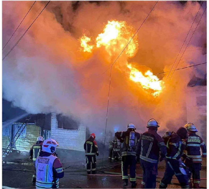
POR MÁS DE UNA HORA BOMBEROS DE PUERTO MONTT DEBIERON TRABAJAR PARA CONTROLAR EL FUEGO.

El informe de la Dideco municipal confirmó que el siniestro dejó un saldo de dos familias afectadas, lo que corresponde