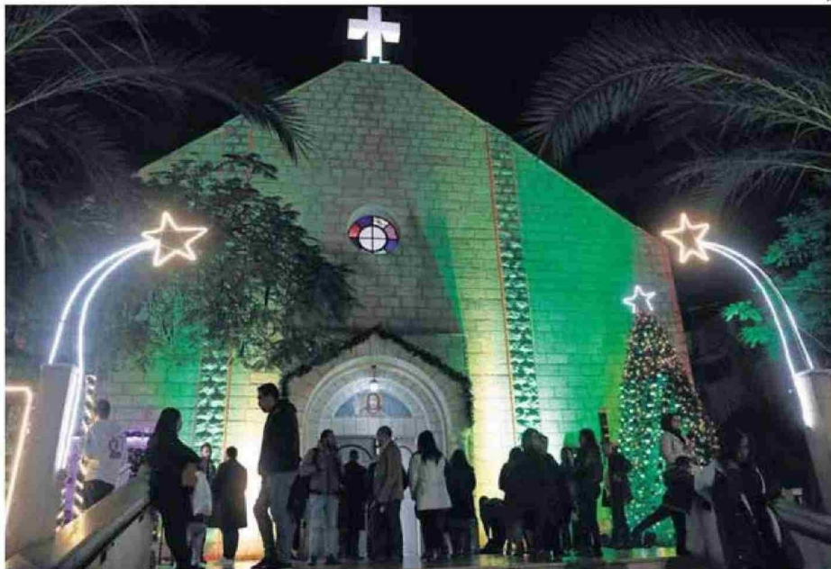
LA PARROQUIA ATACADA AYER, EN UNA IMAGEN DE ARCHIVO DURANTE UNA VÍSPERA NAVIDEÑA EN GAZA.

"Israel lamenta profundamente que una munición perdi-