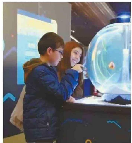
EL ESPACIO BRINDARÁ EXPERIENCIAS INTERACTIVAS.