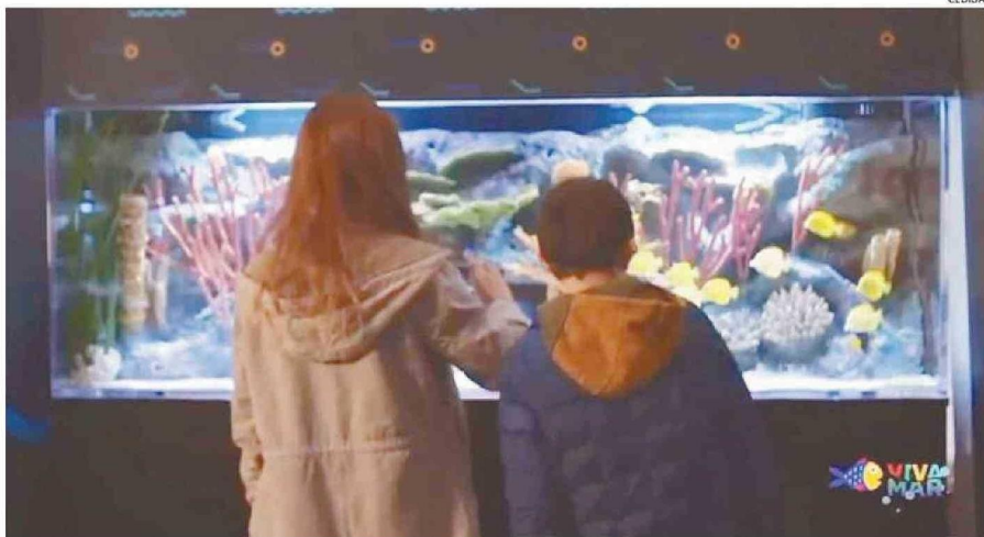
LOS ACUARIOS PERMITEN VER DE CERCA DIVERSAS ESPECIES MARINAS.

Tiraje: 2.200 Lectoría: 6.600 Favorabilidad: No Definida