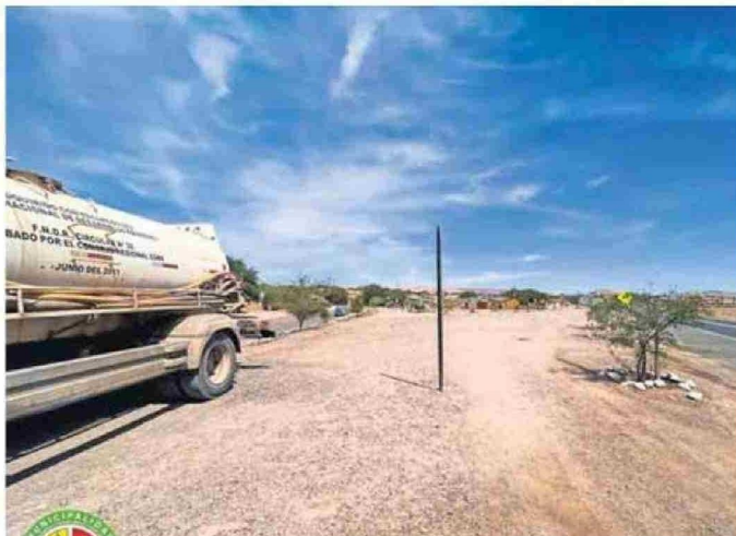
EL MUNICIPIO ENVÍO CAMIONES ALJIBE PARA ABASTECER DE AGUA A LOS HABITANTES DE TOCONAO.

"Debido a la alta turbiedad, tuvo que suspenderse la operación, y enviamos camiones aljibe para garantizar el suministro de agua. Continuaremos apoyando durante el fin de semana", afirmó.