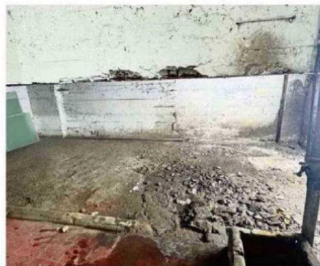
EL SUBSUELO DEL EDIFICIO DE LA QUINTRALA, EN CALLE ESTADO.