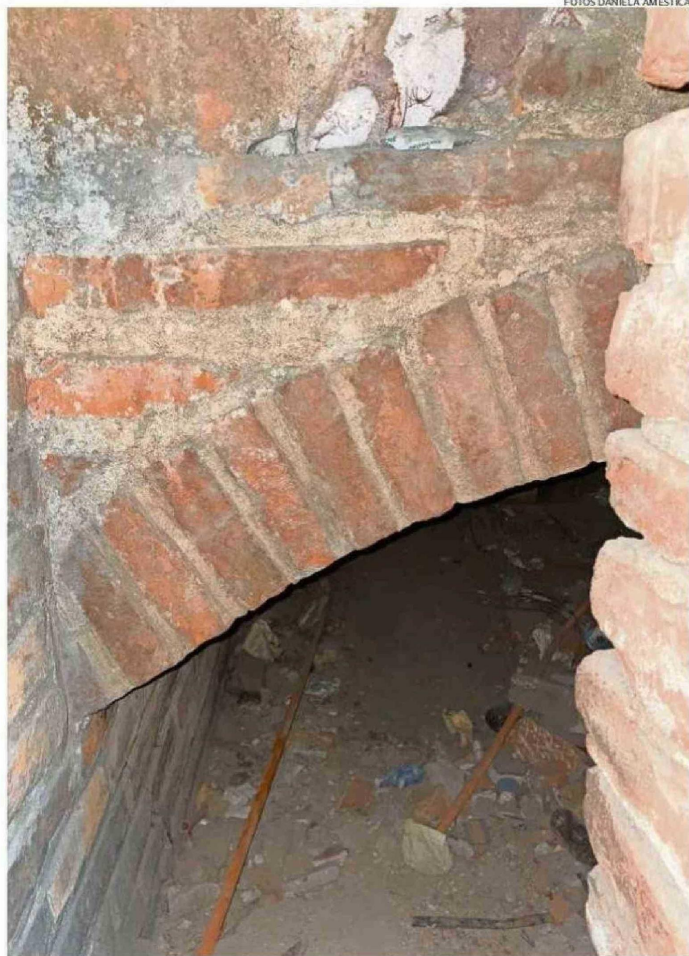
TÚNEL BAJO UN EDIFICIO DE SANTIAGO, EL PRIMERO QUE VISITÓ LA AUTORA.

La autora así llega al exCongreso, donde antes estuvo la Iglesia de la Compañía de Jesús, que a mediados del siglo