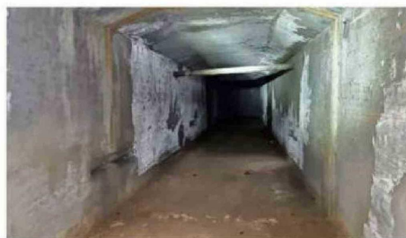
EL EX CONGRESO ANTES FUE UNA IGLESIA JESUITA.

XIX sufrió un incendio donde fallecieron más de 2.000 personas. En clave de novela, la