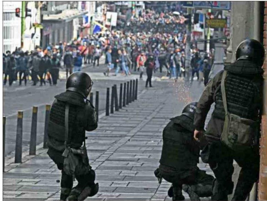
LOS CORTES en los accesos han dejado mercados desabastecidos, escaso combustible y hospitales sin suministro en La Paz.

Mientras que el gobierno nacional denunció ayer que el dirigente de la agrupación de los Ponchos Rojos, Bernabé Gutié-