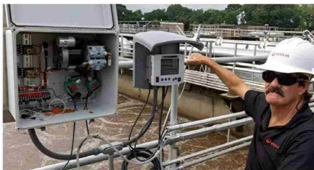
Lecturas de los sensores en un controlador IQ SensorNet 2020 3G.