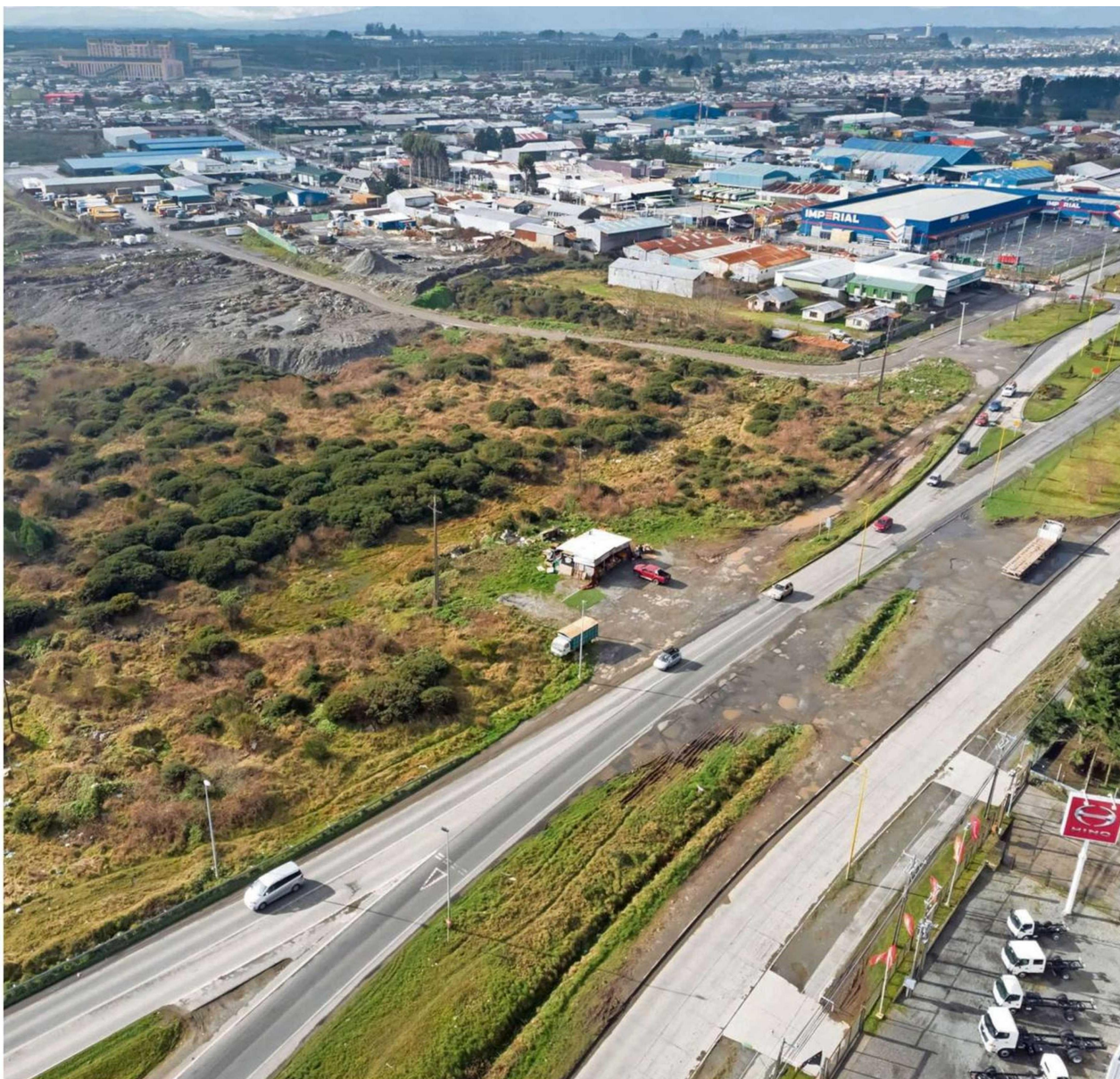
EL SEREMI DE VIVIENDA EXPLICA QUE EN PUERTO MONTT ESTÁN TRABAJANDO CON EL MUNICIPIO EN PROYECTOS HABITACIONALES. (viene de la página anterior)

Tiraje: 6.200 Lectoría: 18.600 Favorabilidad: No Definida