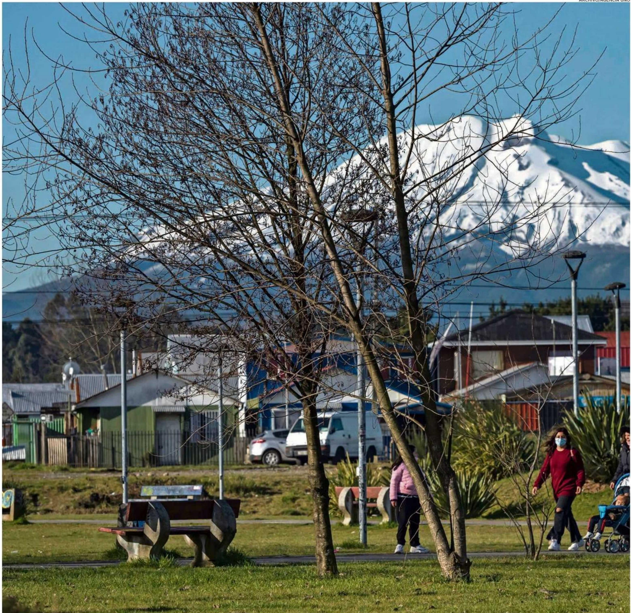
ALERCE YA NO ES LA ZONA QUE CONGREGA LA MAYORÍA DE LOS PROYECTOS HABITACIONALES. AHORA LO ES EL SECTOR HACIA EL TEPUAL.