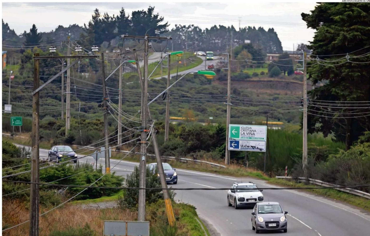
CONTAR CON MEJORES ACCESO A LOS NUEVOS POBLADOS ES UN ASPECTO IMPORTANTE PARA LAS AUTORIDADES, DE CARA A LAS NUEVAS SOLUCIONES HABITACIONALES.