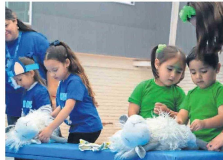
LOS PEQUEÑOS DISFRUTARON MUCHO CADA UNO DE LOS DESAFÍOS.