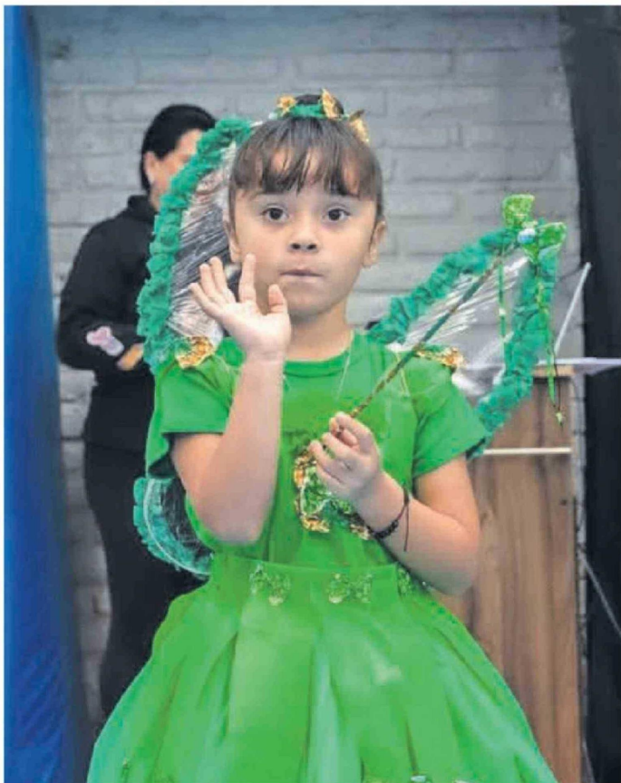
PEQUEÑAS SE DISFRAZARON DURANTE LA JORNADA CON EL COLOR DE SU ALIANZA.