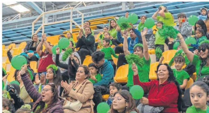
DURANTE DÍAS LOS APODERADOS SE ORGANIZARON PARA QUE LA JORNADA RESULTARA UN ÉXITO.