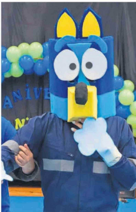
LOS CORPÓREOS ENTREGARON ALEGRÍA A LOS ALUMNOS.

Destacar que este aniversario es una oportunidad para reconocer el camino recorrido y renovar el compromiso con una educación cercana, inclusiva y centrada en las necesidades de cada estudiante.