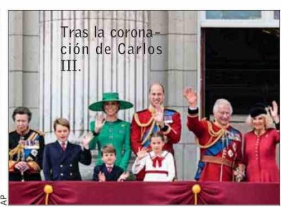
Tras la coronación de Carlos III.