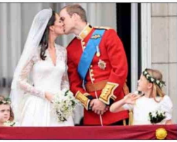
1. Millones de personas vieron por televisión el momento del beso en el balcón del palacio de Buckingham. Al casarse, la reina Isabel II les otorgó el título de duques de Cambridge.