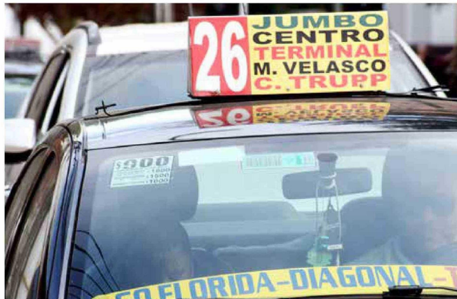
Colectivos en Talca ya cuentan con el valor actualizado visible en el parabrisas de los vehículos.

Para los representantes del rubro, resulta una medida inevitable el aumento del costo del servicio así como lo ha hecho el costo de la vida en general. En ese sentido, ruegan a los vecinos comprendan el contexto en el que se materializa este aumento y que no es