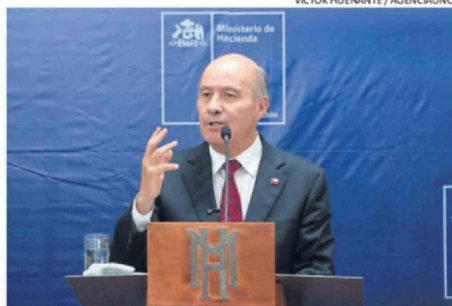
QUIROZ SUMÓ MEDIDAS A LAS ANUNCIADAS POR KAST.

discusión menos que vamos a tener en el Congreso".