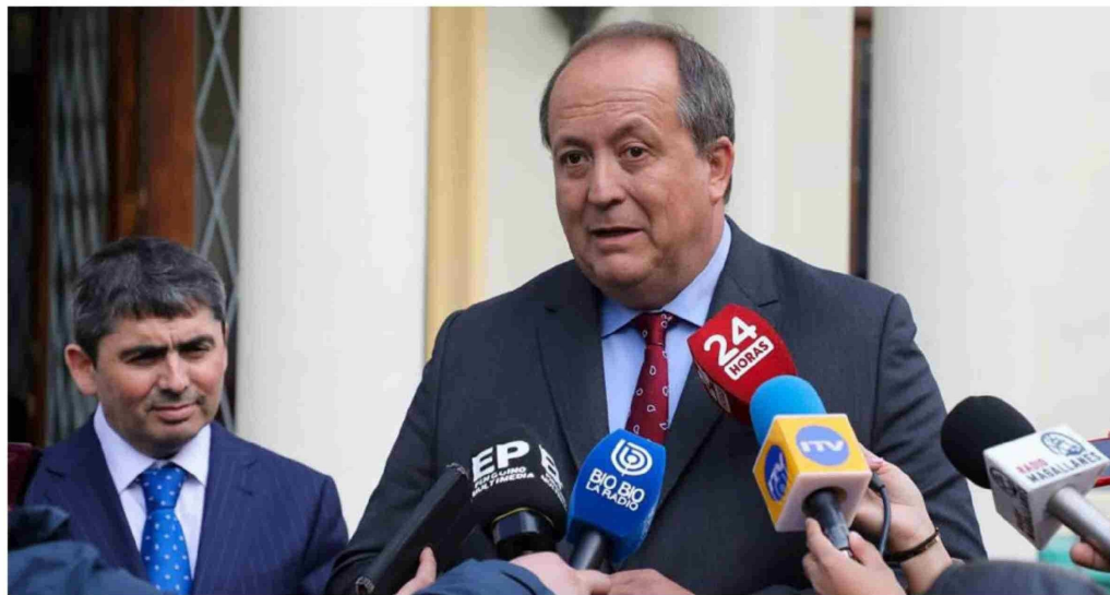
FISCAL NACIONAL ANUNCIÓ "las sanciones más severas del caso" para los funcionarios que viajaron con licencia médica.

Los 42 casos identificados corresponden a 10 fiscales activos y 32 funcionarios pertenecientes a otros estamentos, como personal administrativo, abogados asistentes y asesores, técnicos y auxiliares. Ninguno de los implicados es