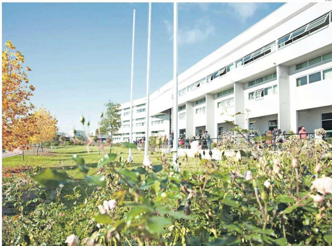
LA PUCV INICIÓ ESTE AÑO EL DOCTORADO EN DIDÁCTICA DE LAS CIENCIAS, ÚNICO EN SU TIPO EN CHILE.

El Doctorado en Ingeniería Informática Aplicada, que la UV comenzó a impartir este año, contempla un plan de estudios con un doble sello: el de formar investigadores y además poder vincularse de manera práctica en los entornos laborales. Este postgrado busca la conexión con el sector productivo público-privado, preparando a los alumnos para resolver problemas complejos de la sociedad, teniendo además un nuevo campo laboral.