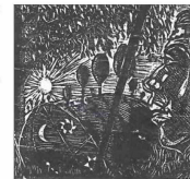
Exponen obra de Rafael Lara con la curaduría de Dan Cameron.

Resaca Castillo. Es un conjunto que se configura también como una suerte de poemas, homenajes, recuerdos de la naturaleza, donde se hace evidente lo luminoso y lo sombrío. "Y es en la simplicidad del agua, en el encanto de una rama, en las montañas y cielos, donde volcaba su intensidad". En las últimas décadas, fue profesor de la Academia de artes Isla del Sur, de Castro, en donde formó a numerosos artistas y artesanos.