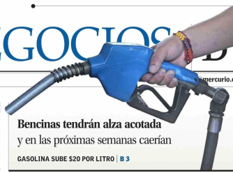
Bencinas tendrán alza acotada y en las próximas semanas caerán