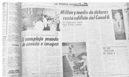
Así contaba La Prensa Austral el 1 de febrero de 1977 la inauguración de esta "joya televisiva" y su complejo sistema, para que los magallánicos pudieran ver TV.