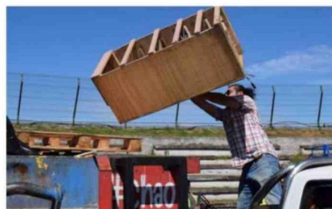
INCANSABLE ES EL TRABAJO QUE SE REALIZA EN EL PROGRAMA "CHAO CACHUREOS".

El éxito y alta convocatoria del "Chao Cachureos", han traído un aumento de cobertura y frecuencia. Respecto al este buen resultado, el alcalde de Temuco, Roberto Neira, manifestó que "es un orgullo que esta iniciativa, que impulsamos cuando llegamos al municipio hace casi cinco años, haya retirado más de 2.200 toneladas de basura de gran volumen, contri-