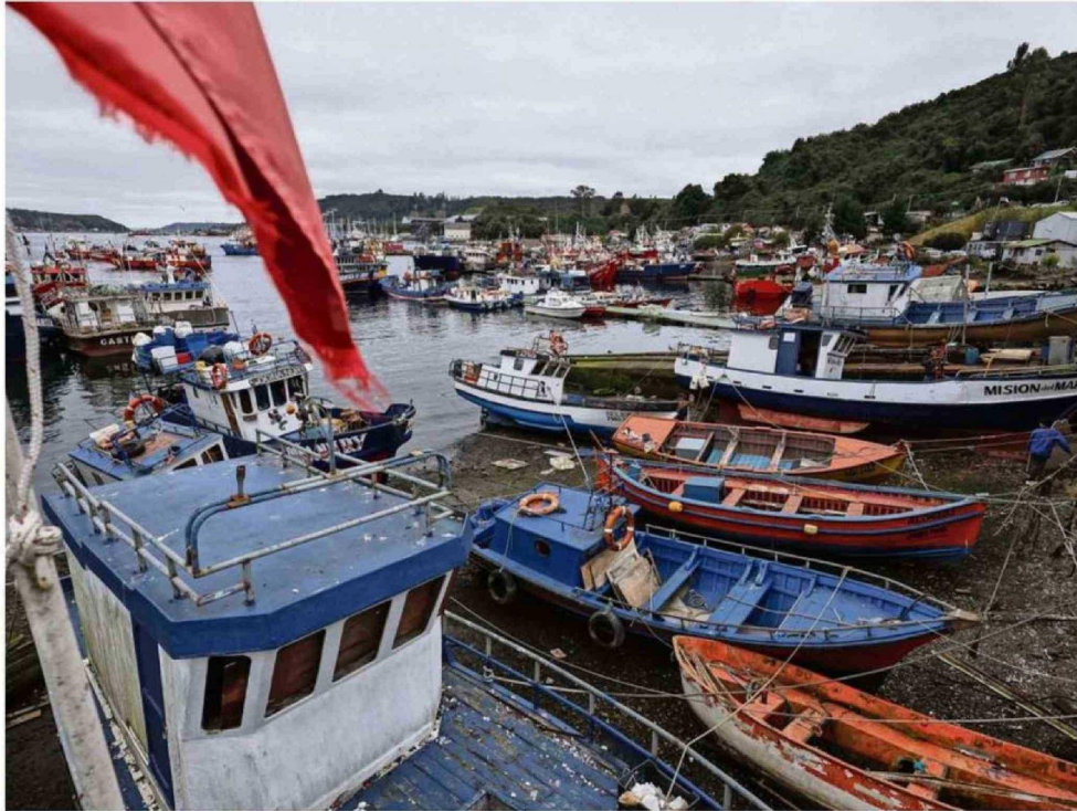
LA ACTIVIDAD PESQUERA TAMBIÉN CONTRIBUYÓ PARA ALCANZAR EL 5,3% DE CRECIMIENTO EN LA ECONOMÍA DE LA REGIÓN DE LOS LAGOS.