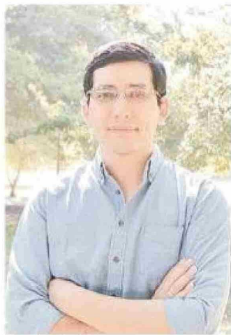
Juan Carlos Claret.

reconciliación con la Iglesia", reveló Claret, quien incluso después de todo este escándalo decidió apostatar, mencionando también cartas que el Papa envió al clero osornino advirtiéndolo sobre errores en el tratamiento de la crisis. El Pontífice impulsó luego gestos de reparación, como la remoción de Barros y se implicó personalmente en el proceso de reconciliación en la diócesis.