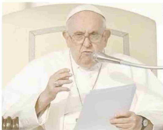
En 2018 Francisco visitó Chile, pero no pasó por Punta Arenas. Su recorrido por Santiago, Temuco e Iquique estuvo marcado por la sombra de los casos de abusos.

Pero, no sólo este hecho ligó el pontificado del argentino en nuestra región.