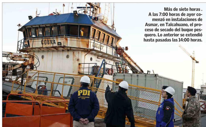
Más de siete horas. A las 7:00 horas de ayer comenzó en instalaciones de Asmar, en Talcahuano, el proceso de secado del buque pesquero. Lo anterior se extendió hasta pasadas las 14:00 horas.

Sobre el término de las diligencias, Cartagena dijo que "no sabemos cuánto va a demorar". Sin embargo, la fiscal adelantó un plazo: "Tenemos que estar