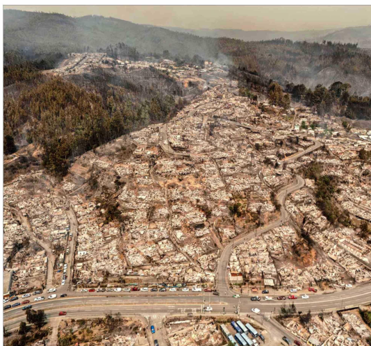
Gran parte de Lirquén, en la Región del Biobío, fue arrasada por las llamas. En ese sector, en la comuna de Penco, se decretó el toque de queda más severo, desde las 19:00 de ayer hasta "nuevo aviso", según dijo el Presidente Boric.

"No hay casas en ningún lado, no queda nada": sobrevivientes y autoridades locales reclaman más ayuda al Gobierno | c 2