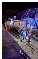
Una de las máquinas descarriló e invadió las vías por las que transitaba un tren en sentido contrario.

Seis claves que considerar al matricularse | A 9