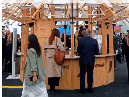
Junto al espacio principal, el evento también cuenta también con un sector de stands.

cambios al SEA que ha planteado el actual gobierno, que a su juicio pueden tensionar el acceso a la justicia, y defendió la propuesta de la administración anterior. Advertió que en el debate "hoy uno escucha de las altas autoridades de este gobierno la caricatura de lo que son los sistemas de evaluación de impacto ambiental, o de los permisos. Creo que eso es un mal comienzo, creo que son sistemas que pueden y deben convivir con otro tipo de actividades". Esta situación, afirma, dificulta el construir acuerdos. Como contrapunto, mencionó experiencias donde objetivos productivos y ambientales han logrado articularse (como el caso del litio), precisamente a partir de procesos que incorporan protección y participación desde el inicio. Badénier, en tanto, afirmó que en este