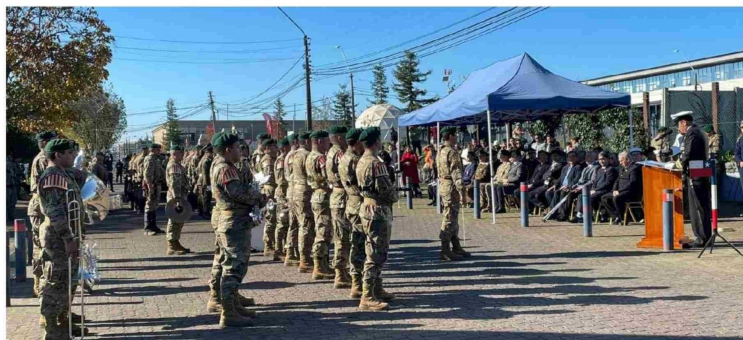
TRAS LA CEREMONIA ORGANIZADA por la Municipalidad de Los Ángeles, hubo un desfile que contó con la participación del Ejército y de Carabineros.

Tras esta actividad, se realizó un desfile que contó con la participación de Carabineros y un grupo de formación del Destacamento Militar de Los Ángeles. La banda instrumental de dicha unidad del Ejército interpretó el himno "Los viejos estandartes".