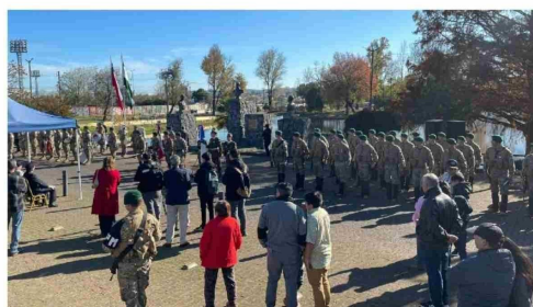
LAS FAVORABLES CONDICIONES climáticas permitieron una alta asistencia de público.

Agregó que la templanza de Prat y su compromiso con la Patria deben inspirar a las nue-