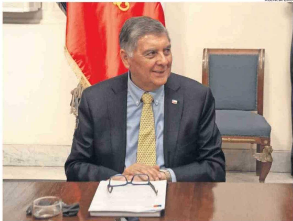
EL JEFE DE GABINETE TAMBIÉN RECONOCIÓ QUE HAY UN PLANO HUMANO EN ESTE CASO.

En entrevista con Radio Pauta, el jefe de gabinete sostuvo que "aquí hay que mirar dos planos. Un plano institucional y un plano personal humano. En el plano institucional, obviamente, todo gobierno tiene que velar por la continuidad de un servicio en los términos que se considere que es lo mejor para las funciones que ese servicio cumple. Y un cargo de Alta Dirección Pública, por naturaleza y por definición, es un cargo de exclusiva confianza, en el cual la autoridad puede solicitar ese cargo en