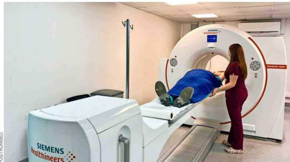
El centro médico especializado cuenta con tecnología de punta para realizar sus procedimientos.