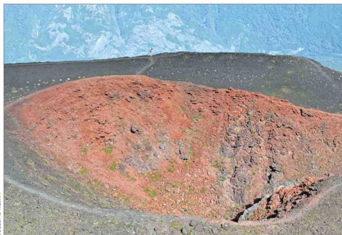
El parque nacional Vicente Pérez Rosales, en la comuna de Puerto Varas, es el más visitado en el país. En la foto, un cráter en el volcán Osorno, en el sector de Ensenada.

"Es distinto el comportamiento de los turistas que visitan las áreas silvestres protegidas. Primero si son nacionales o extranjeros, es totalmente diferente; cada área silvestre protegi-