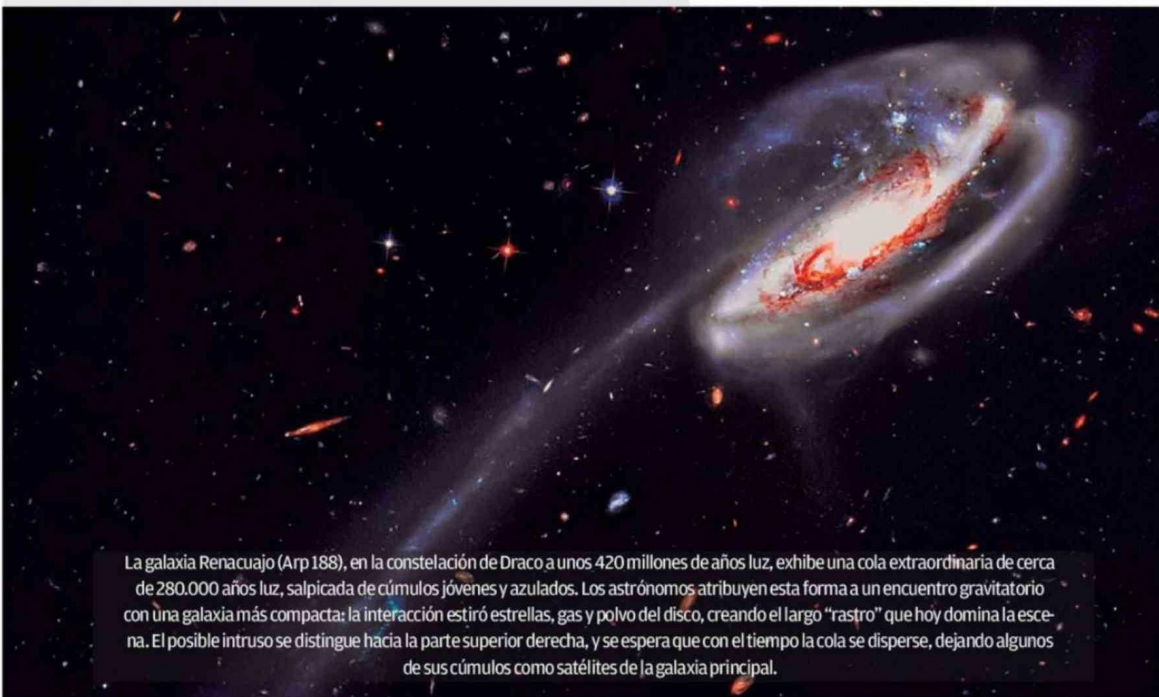
La galaxia Rena cuajo (Arp 188), en la constelación de Draco a unos 420 millones de años luz, exhibe una cola extraordinaria de cerca de 280.000 años luz, salpicada de cúmulos jóvenes y azulados. Los astrónomos atribuyen esta forma a un encuentro gravitatorio con una galaxia más compacta: la interacción estiró estrellas, gas y polvo del disco, creando el largo "rastros" que hoy domina la escena. El posible intruso se distingue hacia la parte superior derecha, y se espera que con el tiempo la cola se disperse, dejando algunos de sus cúmulos como satélites de la galaxia principal.

Actividades gratuitas organizadas por el Centro de Astronomía de la UA Más información: http://www.astro.uantof.cl/extension/agenda