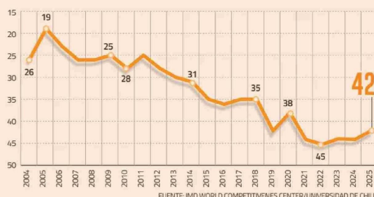
LA TRAYECTORIA DE LA POSICIÓN DEL PAÍS EN LOS ÚLTIMOS AÑOS POSICIÓN EN EL RANKING