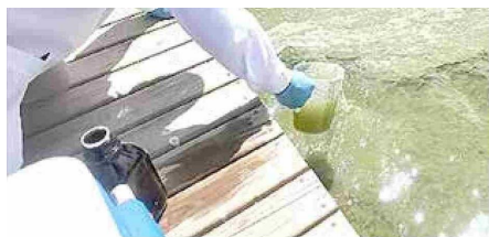
La Seremi de Salud del Maule ha recogido dos muestras.

Tiraje: 4.200 Lectoría: 12.600 Favorabilidad: No Definida