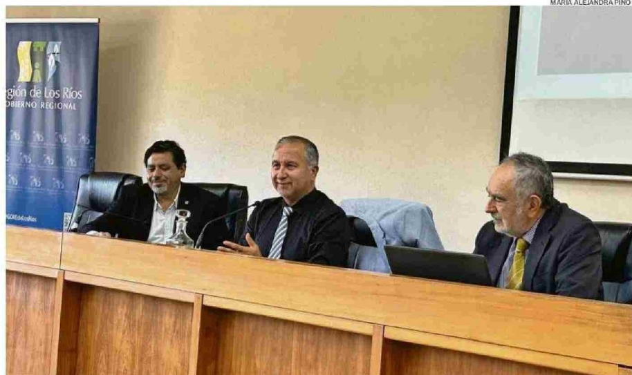
PANEL DE LA AGRUPACIÓN DE UNIVERSIDADES REGIONALES FUE PARTE AYER DEL ENCUENTRO DE CONSEJEROS REGIONALES.

Montecinos detalló que otra contribución es resolver problemas de políticas públicas cuando es mandatado por las instituciones, por ejemplo, para formular programas de