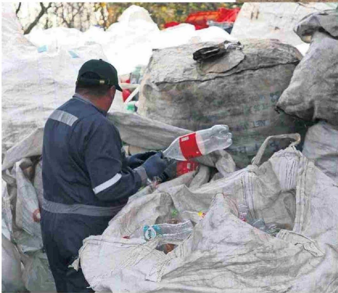
EL AVANZAR EN MATERIA DE RECICLAJE NO SERÁ POSIBLE SIN EL COMPROMISO DE LA COMUNIDAD.