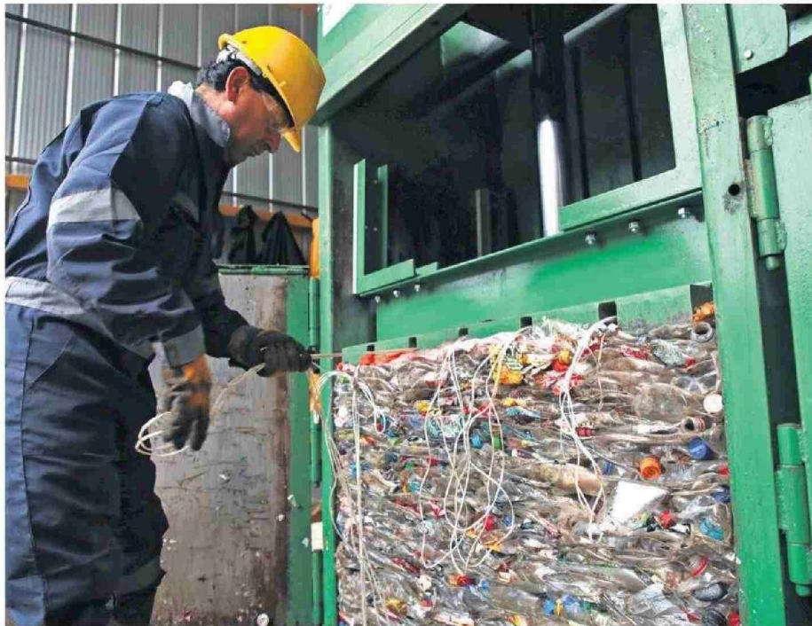
ESFUERZOS PÚBLICOS Y PRIVADOS SURGEN EN LA REGIÓN Y GENERAN LA BASE DE UN FUTURO MÁS SUSTENTABLE.

Sin embargo, dice, para entender el actual escenario local vale la pena recordar que al año 2024 La Araucanía produce casi 400 mil toneladas de residuos, 382 mil toneladas para ser exactos; la mayoría de las cuales van a parar a los sitios de disposición final en Mulchén y Los Ángeles; al único relleno sanitario regional (Malleco Norte) ubicado entre Angol y Collipulli, además de otros seis u ocho vertederos que están en proceso de adecuación para