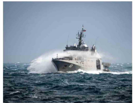
OPV 83 Marinero Fuentealba venciendo el temporal en las aguas del océano austral en Antártica.

Las distintas operaciones de la Armada de Chile se realizan en planificación y coordinación constante, tanto por las complejas condiciones meteorológicas antárticas en donde los