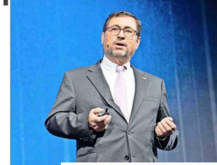
Francisco Pérez Mackenna, ministro de Relaciones Exteriores de Chile, durante su exposición.