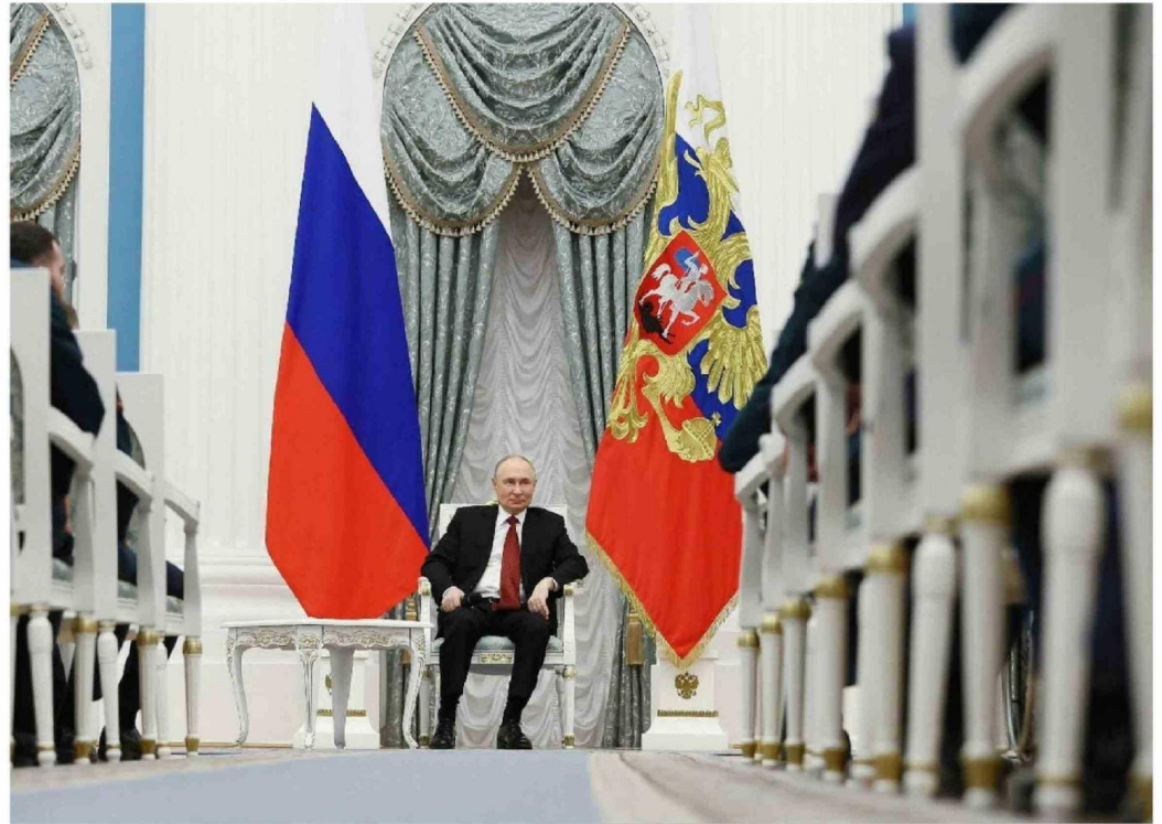
► En esta foto de la agencia Sputnik, el presidente ruso, Vladimir Putin, se reúne con militares en el Kremlin de Moscú.

Los servicios de seguridad rusos han respondido con nuevas y drásticas restricciones, bloqueando la mayor parte de la actividad en línea, imitando el Gran Cortafuegos chino. Estas restricciones, justificadas por la necesidad de prevenir los ataques con drones que continúan sin cesar, son tan severas que incluso los nacionalis-