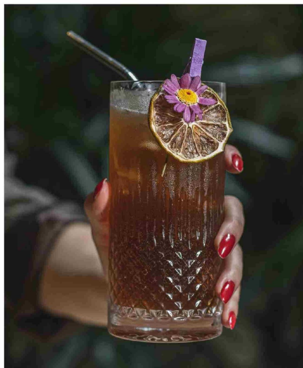
Lejos de una abstinencia radical, los Gen Z se cuestionan cada copa y las consecuencias reales que tendrá tomarla.

Y así, mientras las generaciones anteriores veían el alcohol como una vía de escape con la que evadirse de la ansiedad laboral, para la Generación Z la mejor forma de manejar el estrés es, precisamente, la sobriedad. Porque no tomar alcohol ya no es una restricción: es el nuevo superpoder de la productividad. 🍷