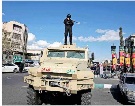
IRÁN dijo estar monitoreando los movimientos militares estadounidenses.

Esa última posibilidad también ha sido destacada por la prensa. The Wall Street Journal, por ejem-