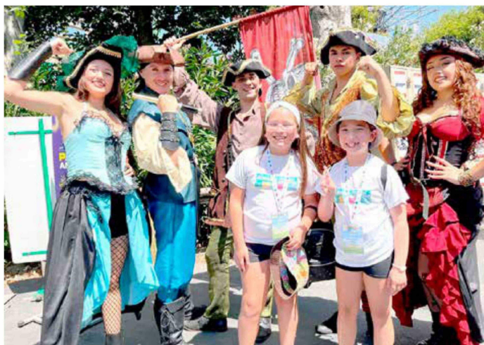
Alumnos se han distraído bastante en las actividades de verano.