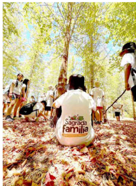
Iniciativa contempló salidas al aire libre para disfrutar de la naturaleza.