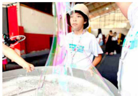
En el Museo Interactivo Mirador se abrieron los sentidos y la imaginación.