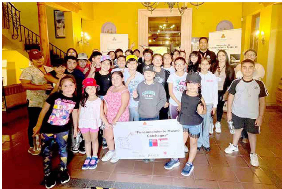
La cultura ha estado presente en las salidas a terreno

Tiraje: 4.200 Lectoría: 12.600 Favorabilidad: No Definida