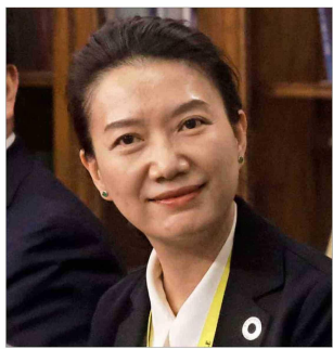
La vicepresidenta sénior de Tianqi Lithium, Wanyu Xiong, en una visita a Chile en 2024.

La china Tianqi Lithium Corporation anunció su intención de vender hasta 1,25% de sus acciones, luego de que la Corte Suprema respaldara el acuerdo con Codelco.