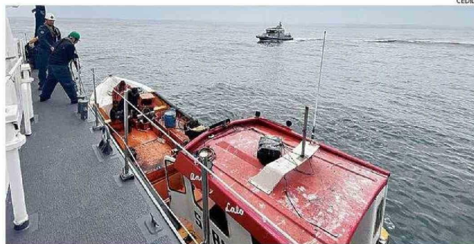
SE EFECTUÓ EL RESCATE DE LA VÍCTIMA A 26 KILÓMETROS MAR ADENTRO.