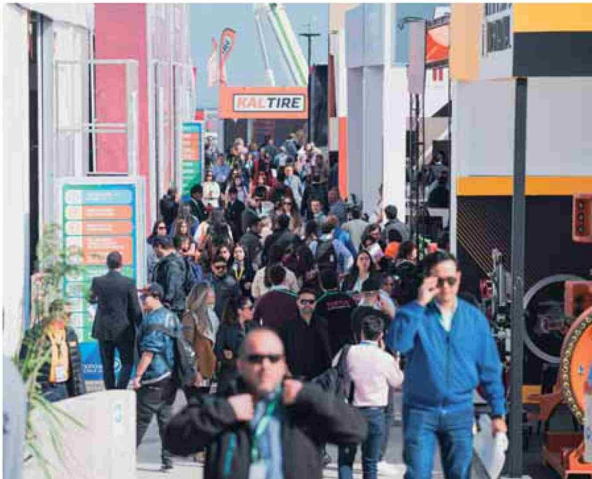
En su edición 2026, la exhibición se dividirá en ocho pabellones: Litio, Plata, Cobre, Yodo, Oro y Molibdeno, a los que se suman dos nuevos: Hierro y Cobalto.