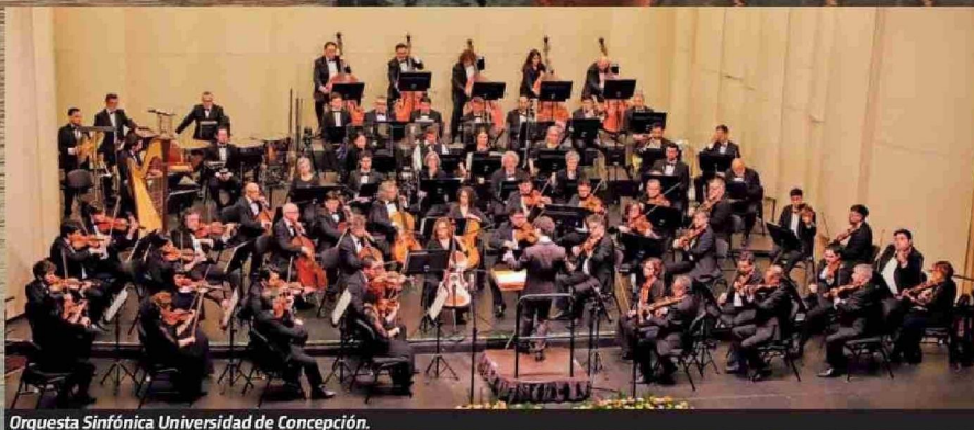
Orquesta Sinfónica Universidad de Concepción.