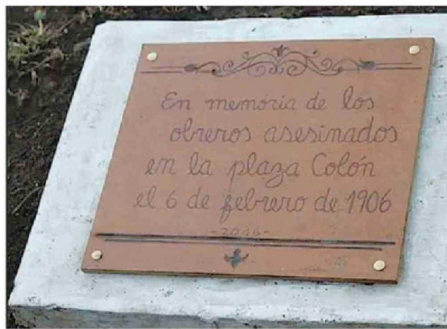
PLACA QUE RECUERDA A LOS CAÍDOS EN LA MASACRE DE ANTOFAGASTA.

“En el contexto de injustas condiciones laborales, los obreros del ferrocarril exigieron quince minutos más de colación y otras medidas menores, pero la Empresa las rechazó completamente; ante la negativa los trabajadores fueron apoyados por la Mancomunal obrera y otros colectivos ideológicos como los anarquistas que habían llegado a la localidad en 1905 integrándose a las faenas obreras y participando en