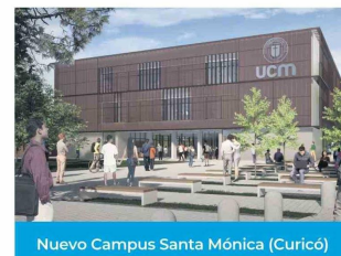
Nuevo Campus Santa Mónica (Curicó)