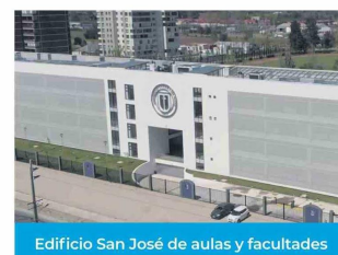
Edificio San José de aulas y facultades