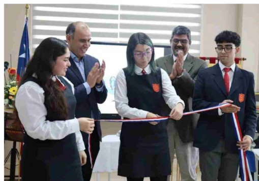
LA INAUGURACIÓN de la biblioteca permitirá potenciar el interés lector en más de mil estudiantes de la comuna.

educativa cuenta con cerca de 350 textos escolares. El objetivo, aseguran, es seguir ampliando el acervo con nuevos libros y recursos didácticos, que serían sumados en los próximos meses.