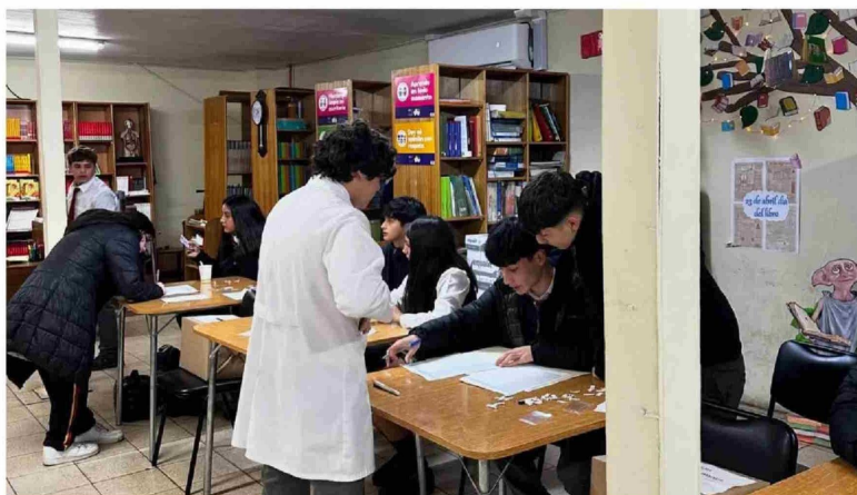
EL NUEVO CENTRO FUE FINANCIADO conjuntamente por la Fundación Emmanuel y Fundación Educacional Cristo Rey.