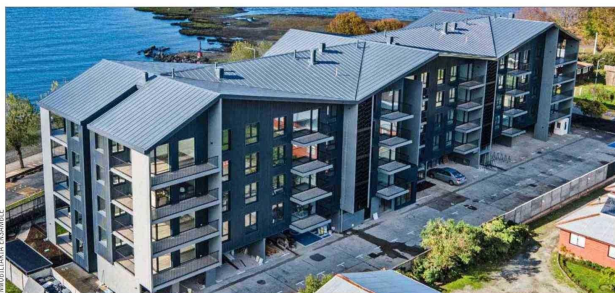
El Edificio Punta Llanquihue, ubicado en Puerto Varas, tiene la certificación CES y está siendo utilizado como referencia para CES Inmobiliario.

Como el objetivo principal de la certificación CES y CES Inmobiliario es mejorar la sustentabilidad de los edificios del país, se está