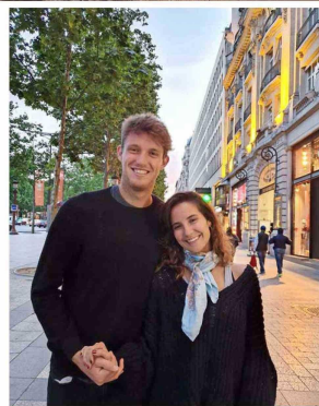
"Decidimos vender (la casa) porque, en el fondo, estábamos todo el rato viajando. Y por ahora es el plan de familia. Entonces, en verdad, no tiene sentido tener una casa en algún lado".

—El tenis me gustaba, jugué de chica. Mi papá es fanático. Yo iba