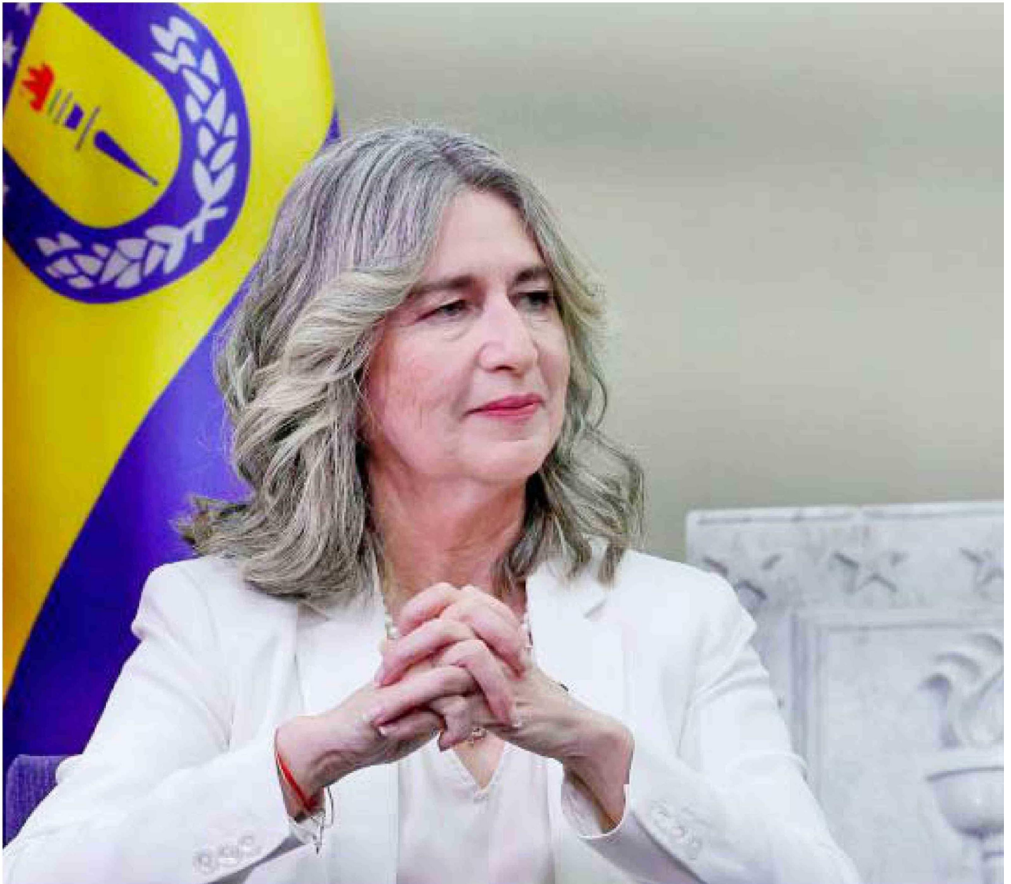
Es la primera mujer que ejercerá el cargo en los 107 años de historia de la Universidad de Concepción.

Próxima a asumir su cargo, repasó los desafíos y principales ejes que tendrá su mandato. “Nuestra universidad debe instalarse en los temas de discusión pública”, comentó.